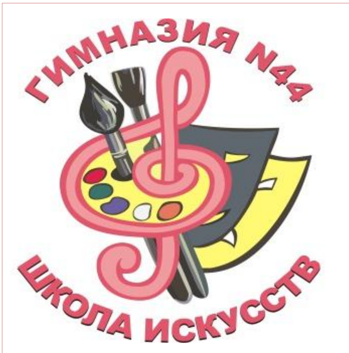
Логотип Школы искусств МБОУ гимназии № 44 г. Иваново