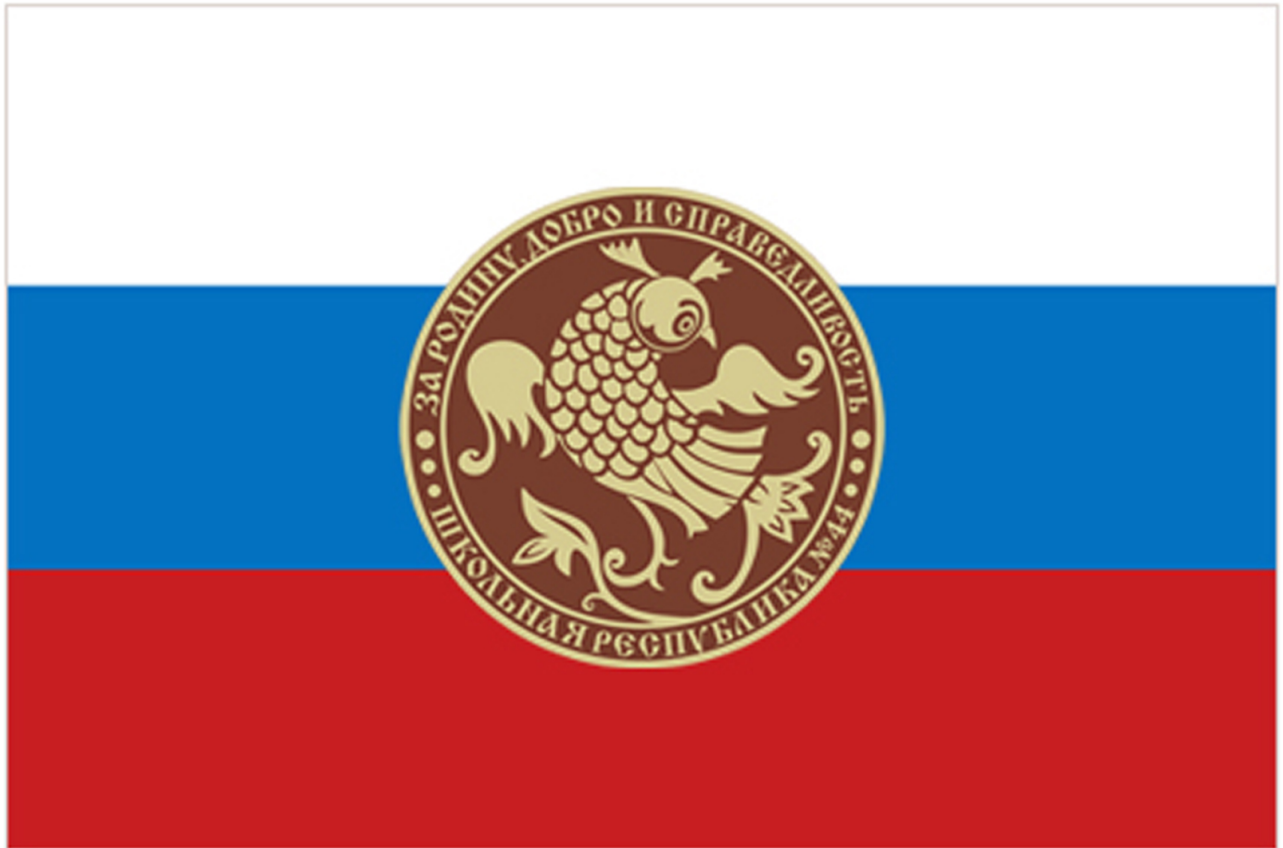
Флаг МБОУ гимназии № 44 г. Иваново