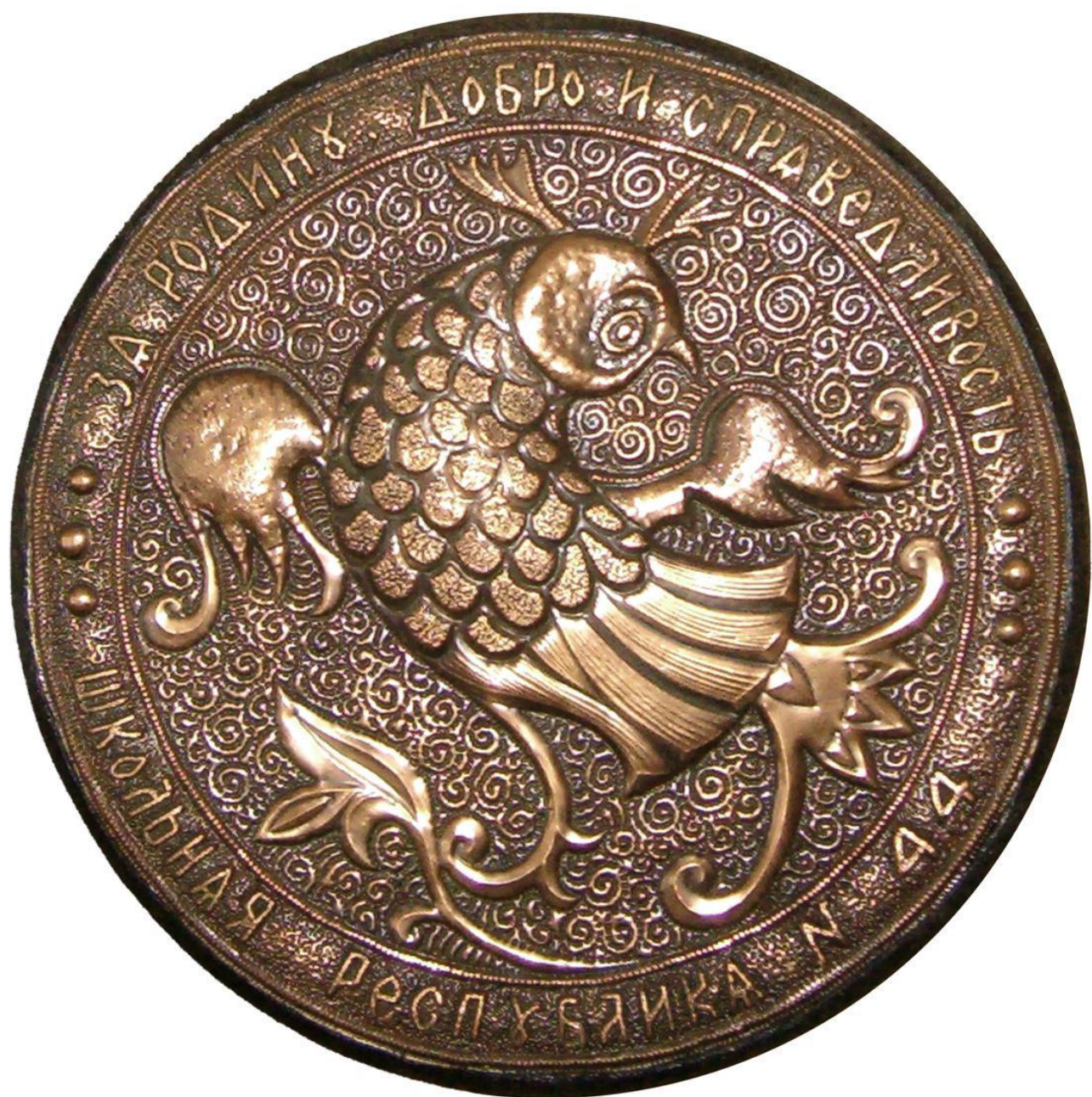
Герб и девиз МБОУ гимназии № 44 г. Иваново