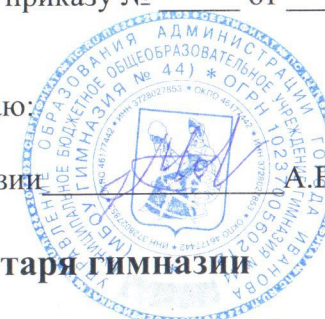
График работы работников инженерно – технических работников, секретаря гимназии на 2024 - 2025 учебный год