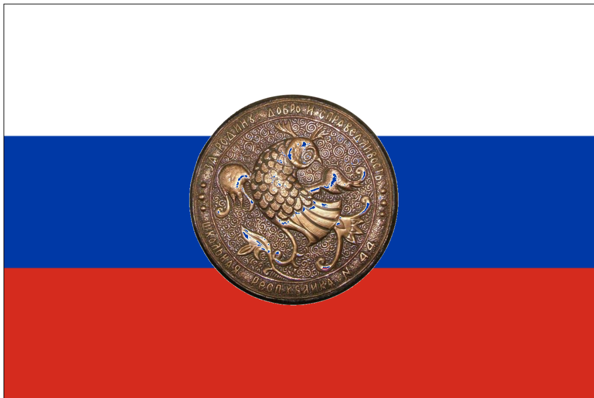
Флаг МБОУ гимназии № 44 г. Иваново