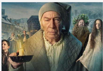
"Необыкновенная история на Рождество" 2017 год; драма, комедия