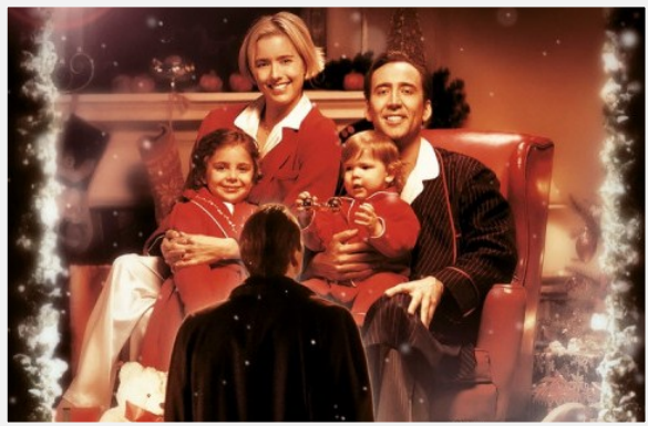
"Семьянин" 2000 год; драма, фэнтези

Что бы вы предпочли: быть президентом крупной инвестиционной компании, жить в роскошной квартире с видом на миллиард долларов, раскатывать на последней модели «Феррари» и при этом оставаться холостяком или работать продавцом автопокрышек у «Большого Эда», покупать одежду в супермаркете и передвигаться по родному пригороду на вместительном и еще не очень старом минивене? Не спешите с ответом, ведь недаром судьба преподносит Джеку шанс попробовать оба варианта. И поверьте, несмотря на обилие комичных ситуаций, которые теперь являются неотъемлемой частью его жизни, Джеку предстоит непростой выбор.