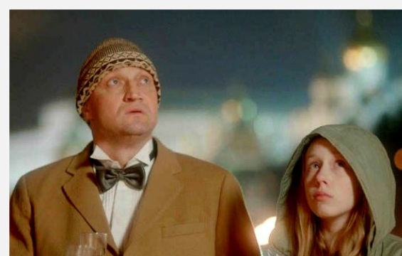
"Со мною вот что происходит" 2012 год; драма

31 декабря. Московские невозможные пробки. Спешка без результатов, помощь, от которой никому не становится легче. Разговоры о бесконечных мелочах, в которых проходит жизнь — а может, уже и прошла. Об отце, которому осталось всего ничего, и ничего не сделаешь. О планах пятнадцатилетней девочки на жизнь: можно стать онкологом, можно — дизайнером еды. О том, что было, и что теперь.